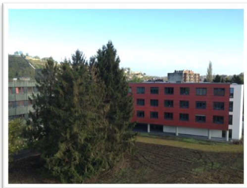
La modernisation de la MRS des Chardonnerets à Jambes (rue de Dave)

En 2018, toutes les Maisons de repos et de soins du CPAS seront mises aux normes (les fameuses normes 2015), deux d'entre elles (Harscamp et La Closière) étant entièrement reconstruites sur un nouveau site (respectivement à Salzinnes au Val Saint-Georges et à Erpent juste à côté du Collège Notre-Dame de la Paix), participant ainsi au redéploiement territorial.