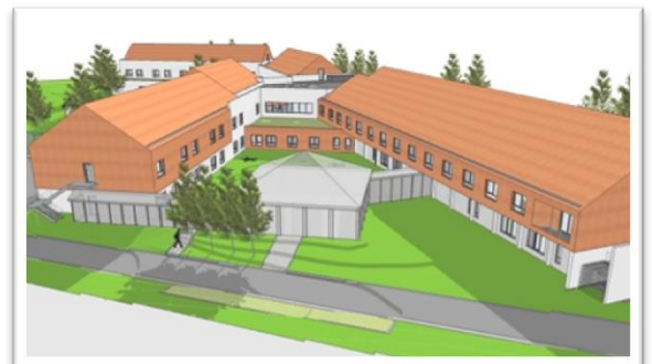
Wépion (Le Grand Pré), plan 3D de la Maison de repos