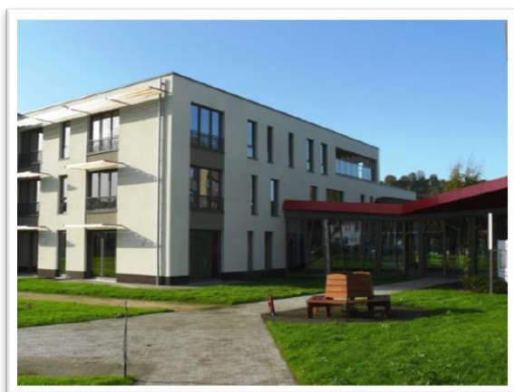
La Résidence-services sociale à Jambes (rue de Dave)

La politique sociale doit innover aussi : le CPAS l'a fait en lançant une carte santé, une cuisine centrale pour une alimentation de qualité des résidents en MRS, un type de restauration adapté aux besoins des seniors au sein des MRS (Fingerfood = alimentation avec les mains), une Pension de famille , une Résidence-services sociale et, aussi, en mettant sur pied deux plates-formes, une pour le soutien à domicile , l'autre pour une maison de convalescence dont les Namurois ont un besoin évident.